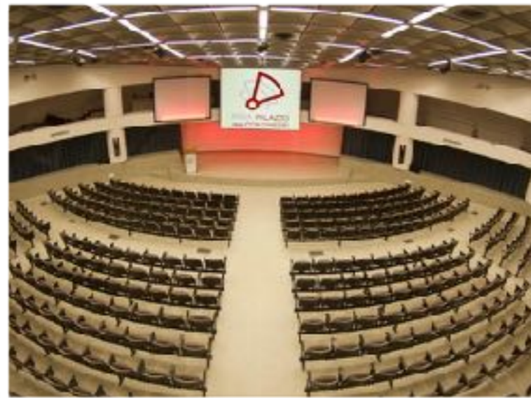
Palazzo dei congressi di Pisa Via Giacomo Matteotti 1 PISA